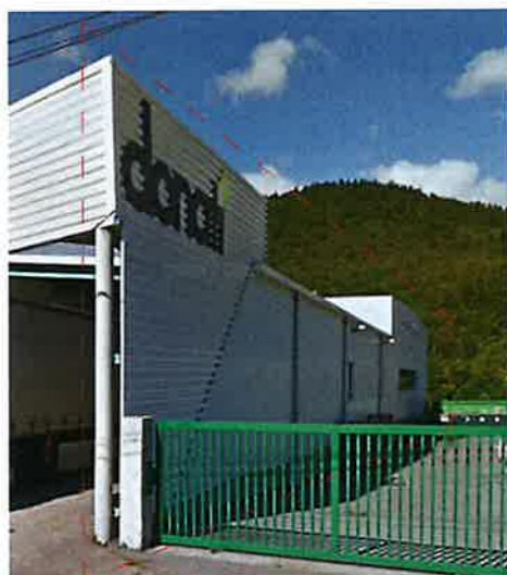
FAÇADE NORD existant