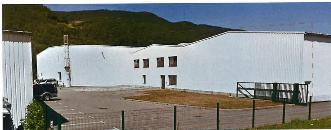
FAÇADE SUD existant