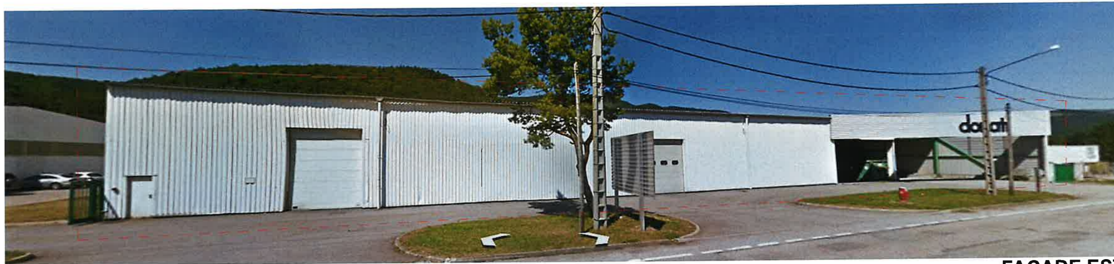
FAÇADE EST existant