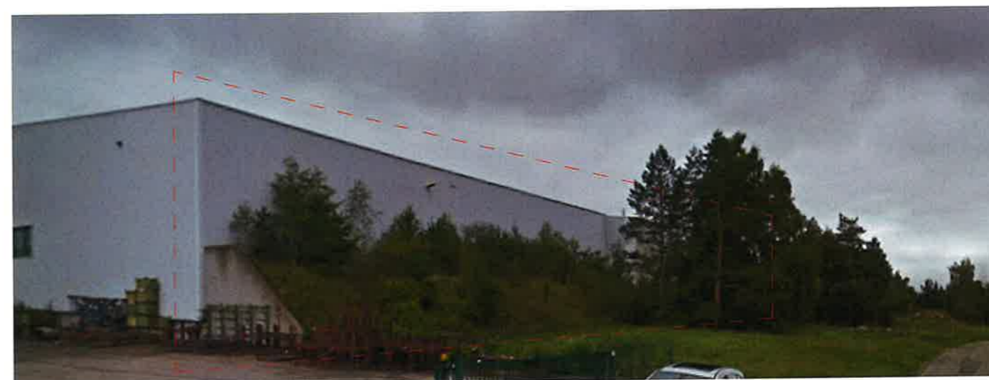
FAÇADE OUEST existant

RÉMI FOURMAUX ARCHITECTE P.A. des Lats 69510 MESSIMY Tél. 04 78 45 02 97 Fax 04 78 45 11 38 N° SIRET 499 317 972 00010 N° TVA FR 85 323 698 886